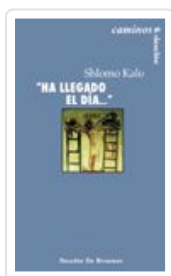
HA LLEGADO EL DIA... KALO SHLOMO