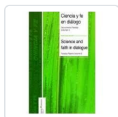
CIENCIA Y FE EN DIALOGO (I) VV.AA.