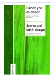
CIENCIA Y FE EN DIALOGO (II)