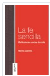
FE SENCILLA ZAMORA, PEDRO