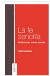
FE SENCILLA ZAMORA, PEDRO