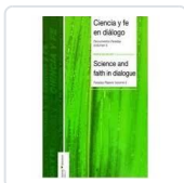
CIENCIA Y FE EN DIALOGO (I) VV.AA.