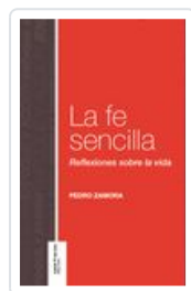
FE SENCILLA ZAMORA,PEDRO