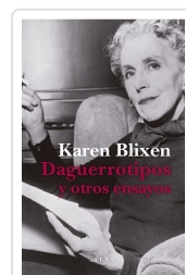
Daguerrotipos y otros ensayos Blixén, Karen