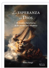
LA ESPERANZA EN DIOS VAUGE, GILLES