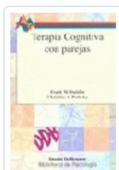
TERAPIA COGNITIVA CON PAREJAS. Nº 73 DATTILIO, FRANK