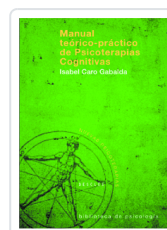
Manual teórico-práctico de Psicoterapias Cognitivas Nº142 Caro Gabalda, Isabel