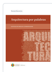
ARQUITECTURA POR PALABRAS DE MOLINA, SANTIAGO