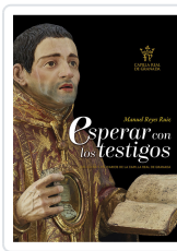
ESPERAR CON LOS TESTIGOS. RELIQUIAS CATEDRAL GRANADA REYES RUIZ, MANUEL