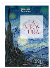
LA IMPOSTURA BERNANOS, GEORGES