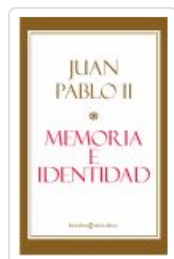
MEMORIA E IDENTIDAD JUAN PABLO II