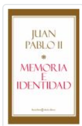
MEMORIA E IDENTIDAD JUAN PABLO II