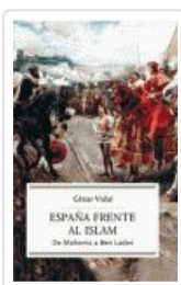
ESPAÑA FRENTE AL ISLAM VIDAL, CESAR