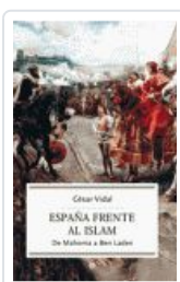
ESPAÑA FRENTE AL ISLAM VIDAL, CESAR