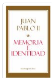
MEMORIA E IDENTIDAD JUAN PABLO II