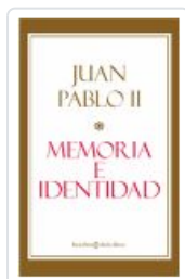
MEMORIA E IDENTIDAD JUAN PABLO II