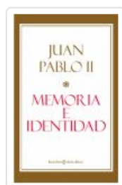
MEMORIA E IDENTIDAD JUAN PABLO II