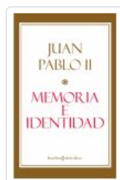
MEMORIA E IDENTIDAD JUAN PABLO II