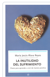
INUTILIDAD DEL SUFRIMIENTO. BOLSILLO ALAVA REYES, MARIA JESUS