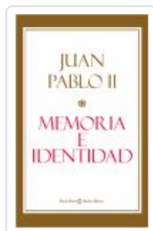
MEMORIA E IDENTIDAD JUAN PABLO II