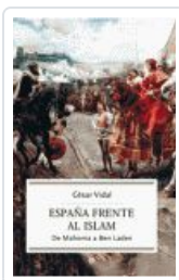
ESPAÑA FRENTE AL ISLAM VIDAL, CESAR