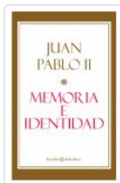
MEMORIA E IDENTIDAD JUAN PABLO II