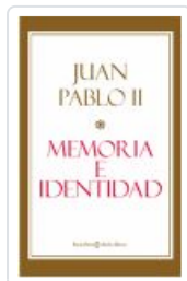
MEMORIA E IDENTIDAD JUAN PABLO II