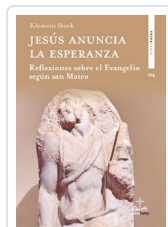
Jesús anuncia la esperanza Klemens Stock