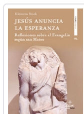
Jesús anuncia la esperanza Klemens Stock