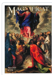
MAGNIFICAT MAYO 2026 AA.VV