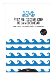
ÉTICA EN LOS CONFLICTOS DE LA MODERNIDAD. SOBRE EL DESEO EL MACINTYRE, ALASDAIR