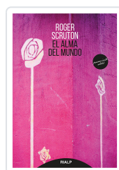
ALMA DEL MUNDO SCRUTON, ROGER