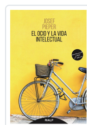
OCIO Y LA VIDA INTELLECTUAL, EL PIEPER, JOSEF