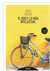
OCIO Y LA VIDA INTELCTUAL, EL PIEPER, JOSEF