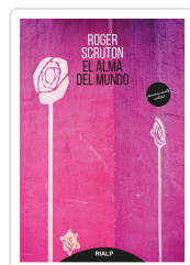
ALMA DEL MUNDO SCRUTON, ROGER