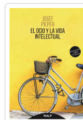
OCIO Y LA VIDA INTELECTUAL, EL PIEPER, JOSEF