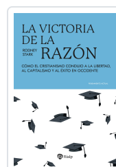
La victoria de la razón Stark, Rodney