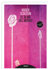
ALMA DEL MUNDO SCRUTON, ROGER