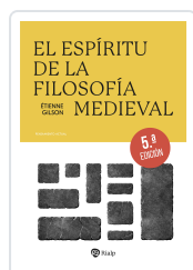
El espíritu de la Filosofía Medieval Gilson, Étienne