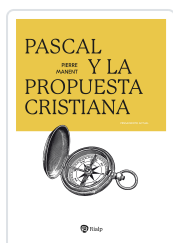
Pascal y la propuesta cristiana Manent, Pierre