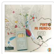
PINTO MI MUNDO 2 POTOLO BAT, MUXOTE