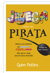
JUEGA COMO UN PIRATA ROLLINS, Q.