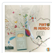
PINTO MI MUNDO 2 POTOLO BAT, MUXOTE