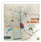
PINTO MI MUNDO 2 POTOLO BAT, MUXOTE