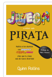
JUEGA COMO UN PIRATA ROLLINS, Q.