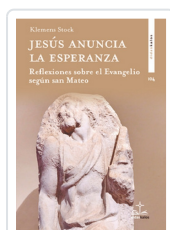
Jesús anuncia la esperanza Klemens Stock