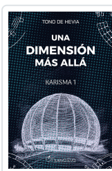
Una dimensión más allá De Hevia, Tono