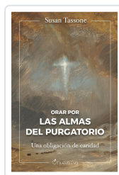
Orar por las almas del purgatorio Tassone, Susan