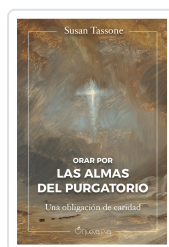
Orar por las almas del purgatorio Tassone, Susan