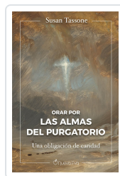
Orar por las almas del purgatorio Tassone, Susan