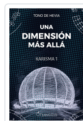
Una dimensión más allá De Hevia, Tono