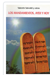
MANDAMIENTOS, AYER Y HOY SALVOLDI, VALENTIN