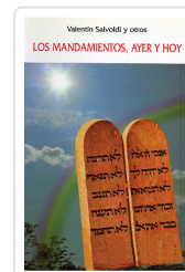
MANDAMIENTOS, AYER Y HOY SALVOLDI, VALENTIN