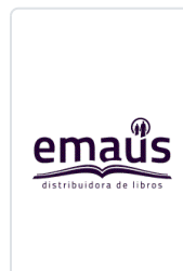
VIDA DE JESUS. (HIJAS S.P) PARAZZOLI, F