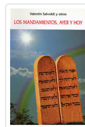
MANDAMIENTOS, AYER Y HOY SALVOLDI, VALENTIN