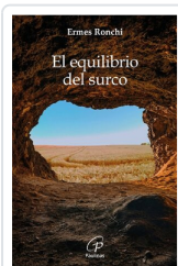
El equilibrio del surco Ermes Ronchi