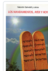
MANDAMIENTOS, AYER Y HOY SALVOLDI, VALENTIN