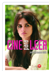
CINE PARA LEER 2008 JULIO- DICIEMBRE EQUIPO RESEDA