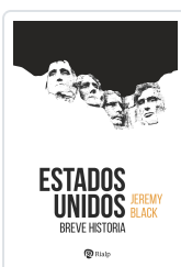
Estados Unidos Black, Jeremy