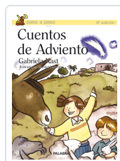
CUENTOS DE ADVIENTO KAST, GABRIELA