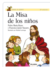
MISA DE LOS NIÑOS, LA REYES/NAVARRO