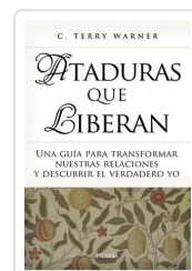
ATADURAS QUE LIBERAN WARNER, C. TERRY