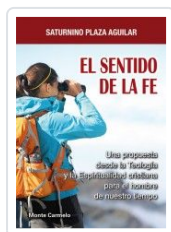
SENTIDO DE LA FE, EL PLAZA AGUILAR, SATURNINO