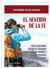
SENTIDO DE LA FE, EL PLAZA AGUILAR, SATURNINO