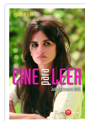
CINE PARA LEER 2008 JULIO- DICIEMBRE EQUIPO RESEDA