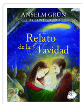
El relato de la Navidad Grün, Anselm