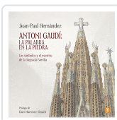
ANTONI GAUDI: LA PALABRA EN LA PIEDRA HERNANDEZ, JEAN PAUL