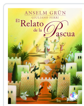
RELATO DE LA PASCUA, EL. GRUN, A./FERRI, G.