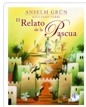
RELATO DE LA PASCUA, EL. GRÜN, A./FERRI, G.