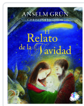
El relato de la Navidad Grün, Anselm