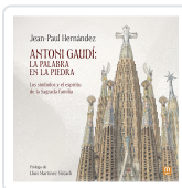
ANTONI GAUDI: LA PALABRA EN LA PIEDRA HERNANDEZ, JEAN PAUL