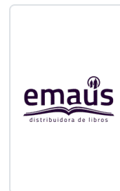
TEXTOS FUNDAMENTALES. SOCIOLOGIA DE LA EDUCACION SELECC. DE A. GRAS