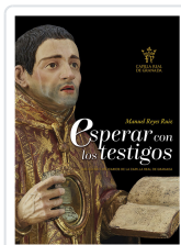
ESPERAR CON LOS TESTIGOS. RELIQUIAS CATEDRAL GRANADA REYES RUIZ, MANUEL