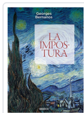
LA IMPOSTURA BERNANOS, GEORGES