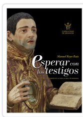
ESPERAR CON LOS TESTIGOS. RELIQUIAS CATEDRAL GRANADA REYES RUIZ, MANUEL