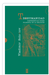
TEOHUMANIDAD SOLOVIOV, VLADIMIR