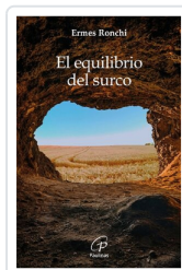
El equilibrio del surco Ermes Ronchi