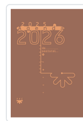
AGENDA DE PASTORAL 2025-2026 PPC PPC