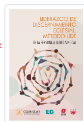
Liderazgo de discernimiento eclesial: Método LIDE LIDE, Equipo