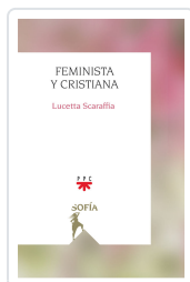
FEMINISTA Y CRISTIANA SCARAFFIA, LUCETTA